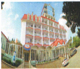
Рис. 1. Пример оформления рисунка

Так выглядит основной текст. Це основний текст. Це основний текст. Це основний текст. Це основний текст. Це основний текст. Це основний текст. Це основний текст. Це основний текст. Це основний текст. Це основний текст. Це основний текст. Це основний текст. Це основний текст.